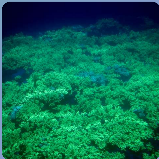
ライトアップにより美しく輝く サンゴをぜひご覧ください。